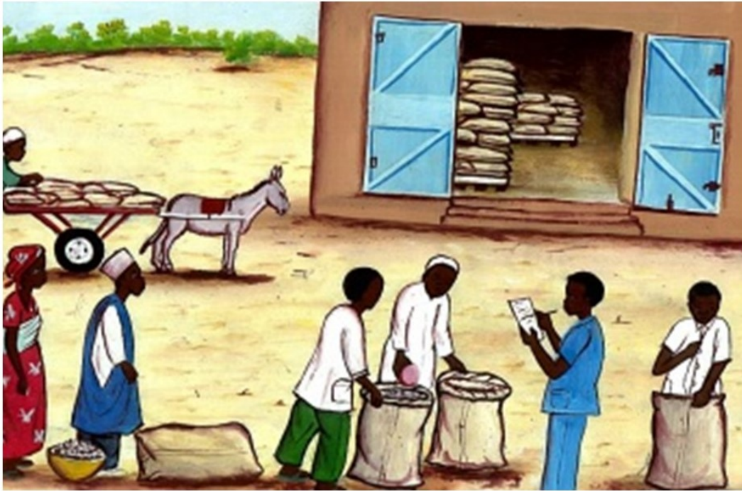
Les agriculteurs livrent les céréales à l'entrepôt, et un agent enregistre la quantité et la qualité